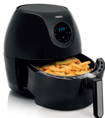
Princess Digital Family Aerofryer 01.182050.01.001

PARTS DESCRIPTION / ONDERDELENBESCHRIJVING / DESCRIPTION DES PIÈCES / TEILEBESCHREIBUNG / DESCRIPCIÓN DE LAS PIEZAS / DESCRIÇÃO DOS COMPONENTES / DESCRIZIONE DELLE PARTI / BESKRIVNING AV DELAR / OPIS CZĘŚCI / POPIS SOUČÁSTI / POPIS SOUČASTI / ОПИСАНИЕ ЗАПЧАСТИ